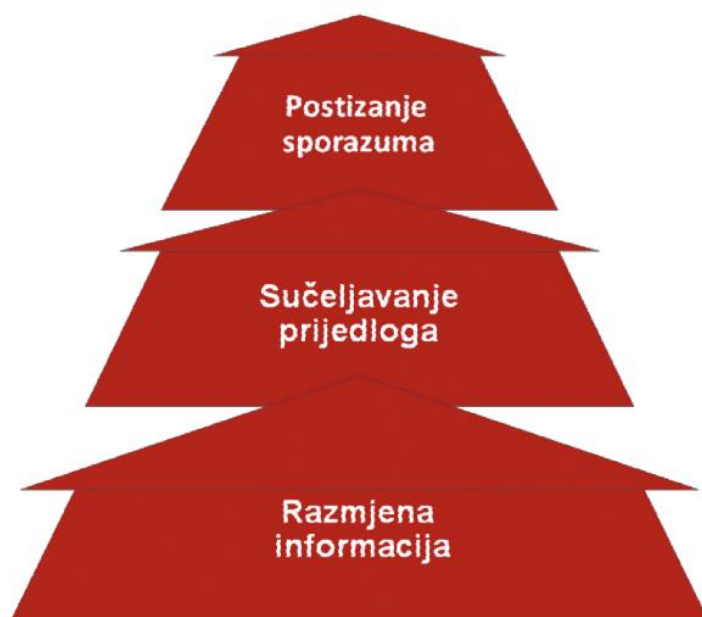
Slika 1. Poslovno pregovaranje